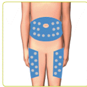
Rotation scheme for Injection sites